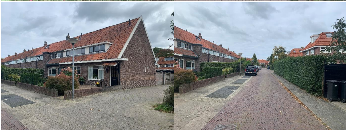
Straatbeelden uit de directe omgeving van de Huibert van Eijkenstraat