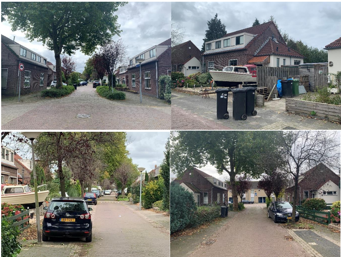
Straatbeeld Huibert van Eijkenstraat: bomen, verwijdend profiel (smal bij entrees), forse voortuinen

Onder het kopje zeldzaamheid staat in een ingewikkelde zin dat dat dit de oudste door een corporatie gestichte woningbouw buiten de vesting is en dat dit voor Naarden vrij zeldzaam is. Verder wordt de 'embryonaal gebleven tuindorp-achtige context' vrij zeldzaam genoemd. We zouden het vooral plaatselijk willen zoeken: een vroeg voorbeeld van complexmatige sociale woningbouw buiten de veste. Binnen de sociale woningbouwproductie uit de jaren twintig in de omgeving van Amsterdam is dit complex van geen of ondergeschikte betekenis.