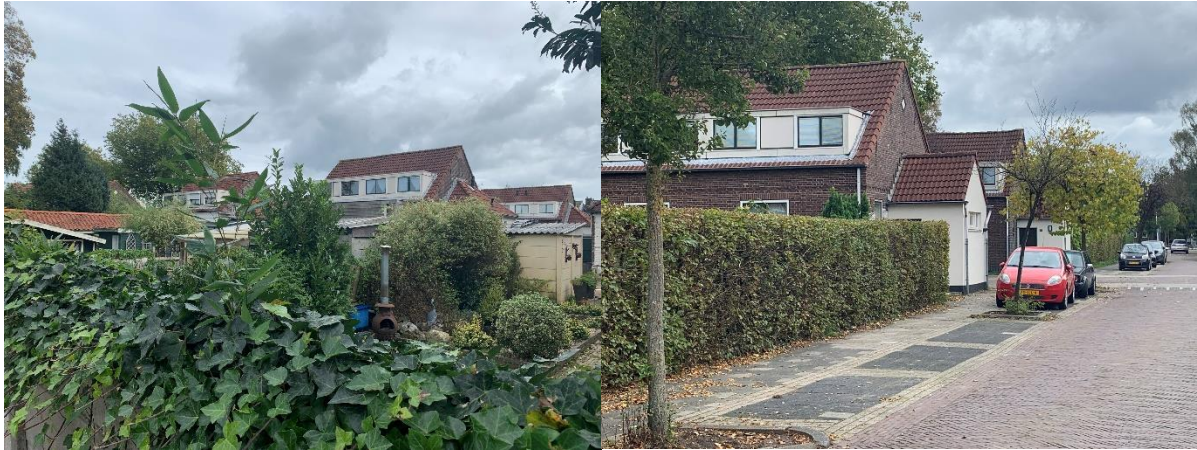
Huibert van Eijkenstraat: zeer diepe achtertuinen. Kopblokken op de hoek Evert de Bruijnstraat.