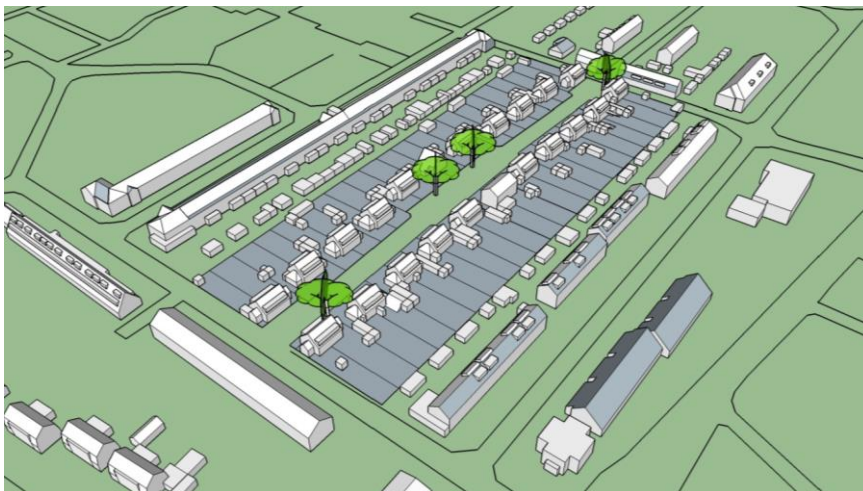
Bestaande toestand (uit: Herstructurering Huibert van Eijkenstraat, 2017)

Ook hebben wij onze bedenkingen bij de verkavelingsstudie die Woningstichting Naarden in 2017 heeft laten uitvoeren. In de wijk lopen zo'n beetje alle straten en bouwblokken evenwijdig, haaks op de trekvaart. Een verkaveling die 90 graden is gedraaid, strijkt dan als het ware tegen de haren in. Het schaadt de structuur van de wijk, maar levert ook nog eens nare voor- en achterkant conflicten op. De Huibert van Eijkenstraat valt ruimtelijk uiteen in zijtuinen (doorgaans schuttingen), parkeerkeffers en enkele blokjes met oriëntatie op de straat. De dwarsstraten zijn immense parkeerkeffers en oriënteren zich op de schuttingen van de achtertuinen aan weerszijden van het plangebied. Naast al deze stedenbouwkundige gebreken, ligt het buurtje als een Fremdkörper in zijn omgeving, het lijkt voor een heel ander stuk stad gemaakt.